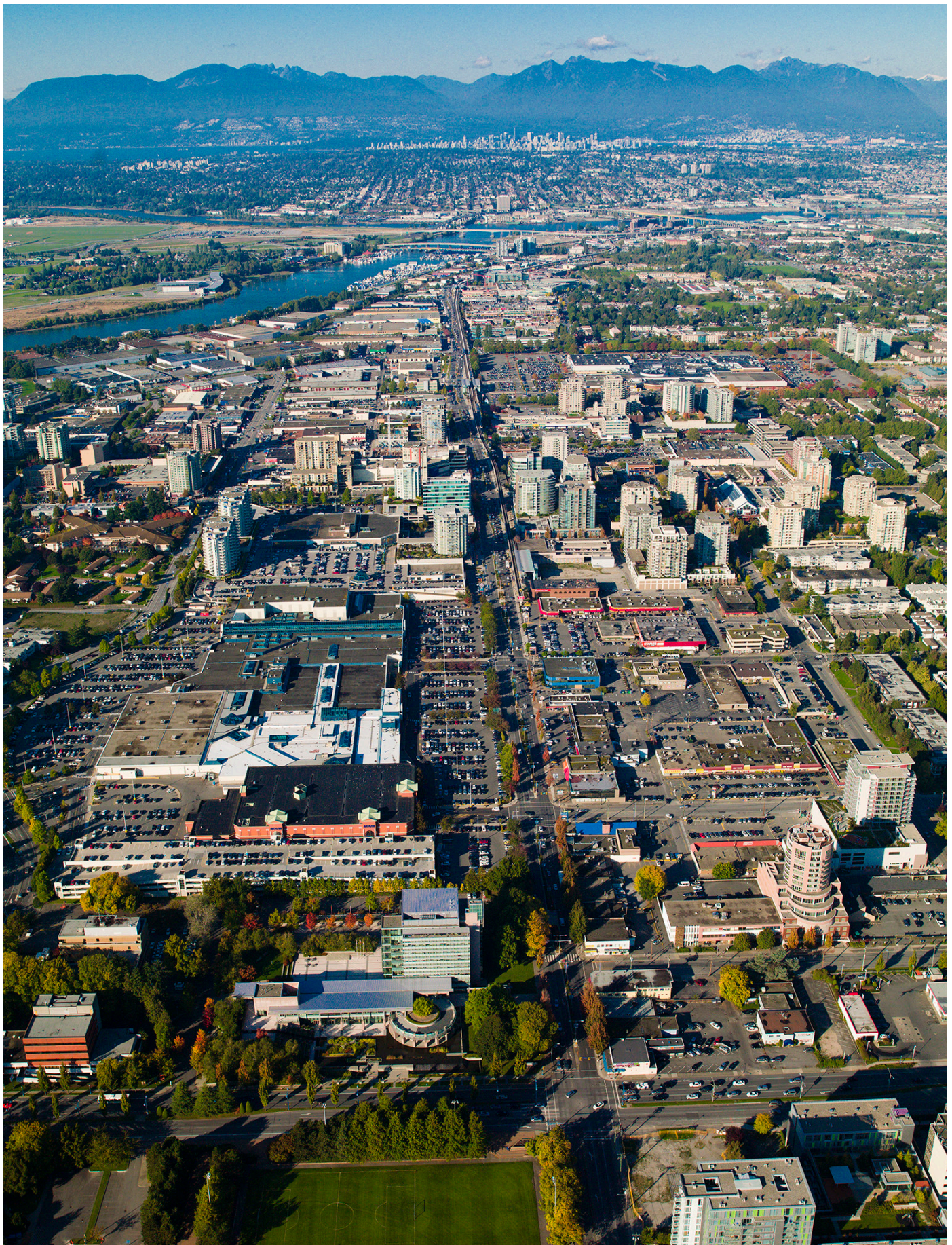
No. 3 Road, vista aérea