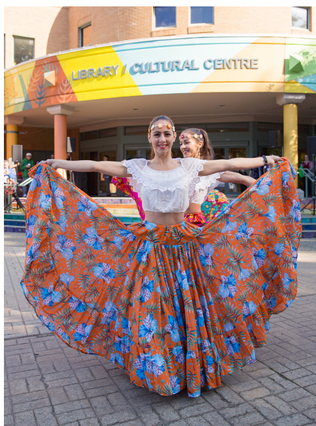
Jornadas culturales de Richmond