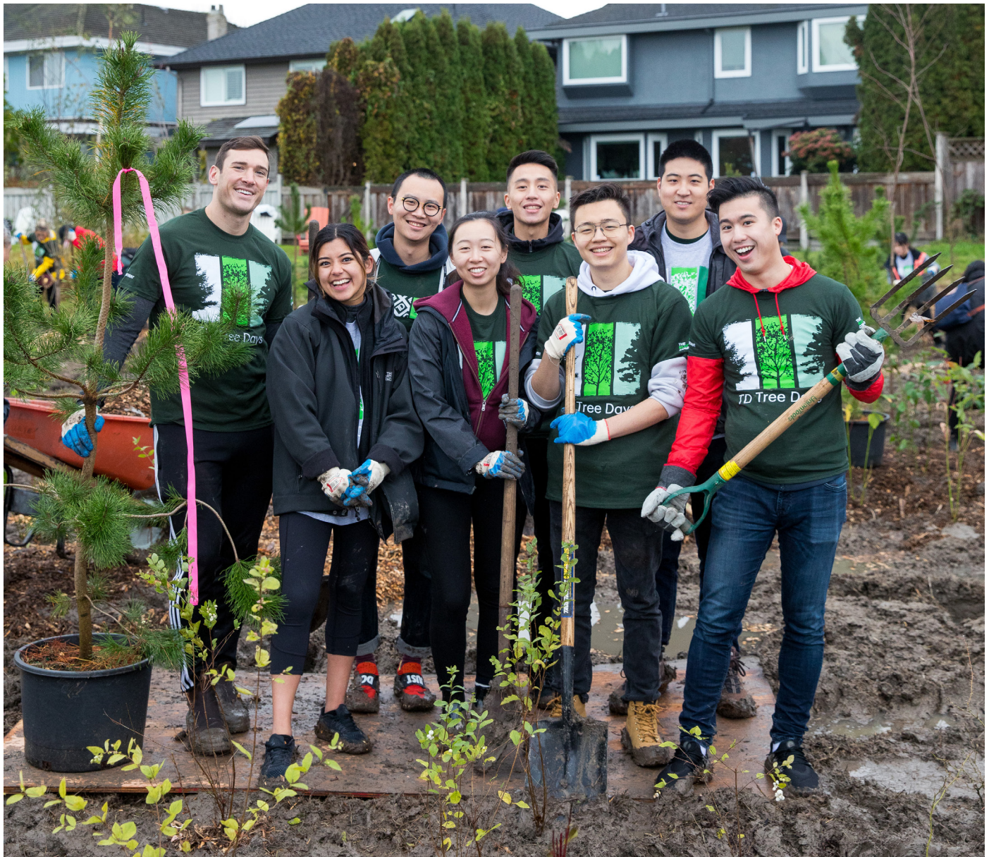
Voluntariado en el Parque Rural Terra Nova

La Richmond Chamber of Commerce (Cámara de Comercio de Richmond) es una amplia asociación empresarial sin ánimo de lucro que representa los intereses de casi 1,000 empresas afiliadas y les ofrece oportunidades para establecer contactos. Las empresas proceden de diversos sectores y profesiones e incluyen corporaciones nacionales e internacionales, empresas medianas, nuevas empresas emprendedoras y pequeñas empresas. Para obtener más información: www.RichmondChamber.ca .