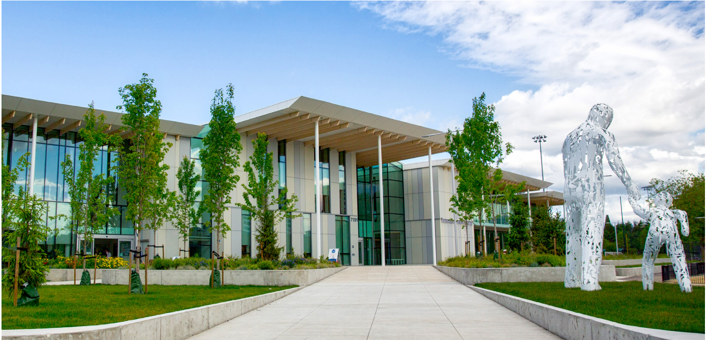
Minoru Centre for Active Living