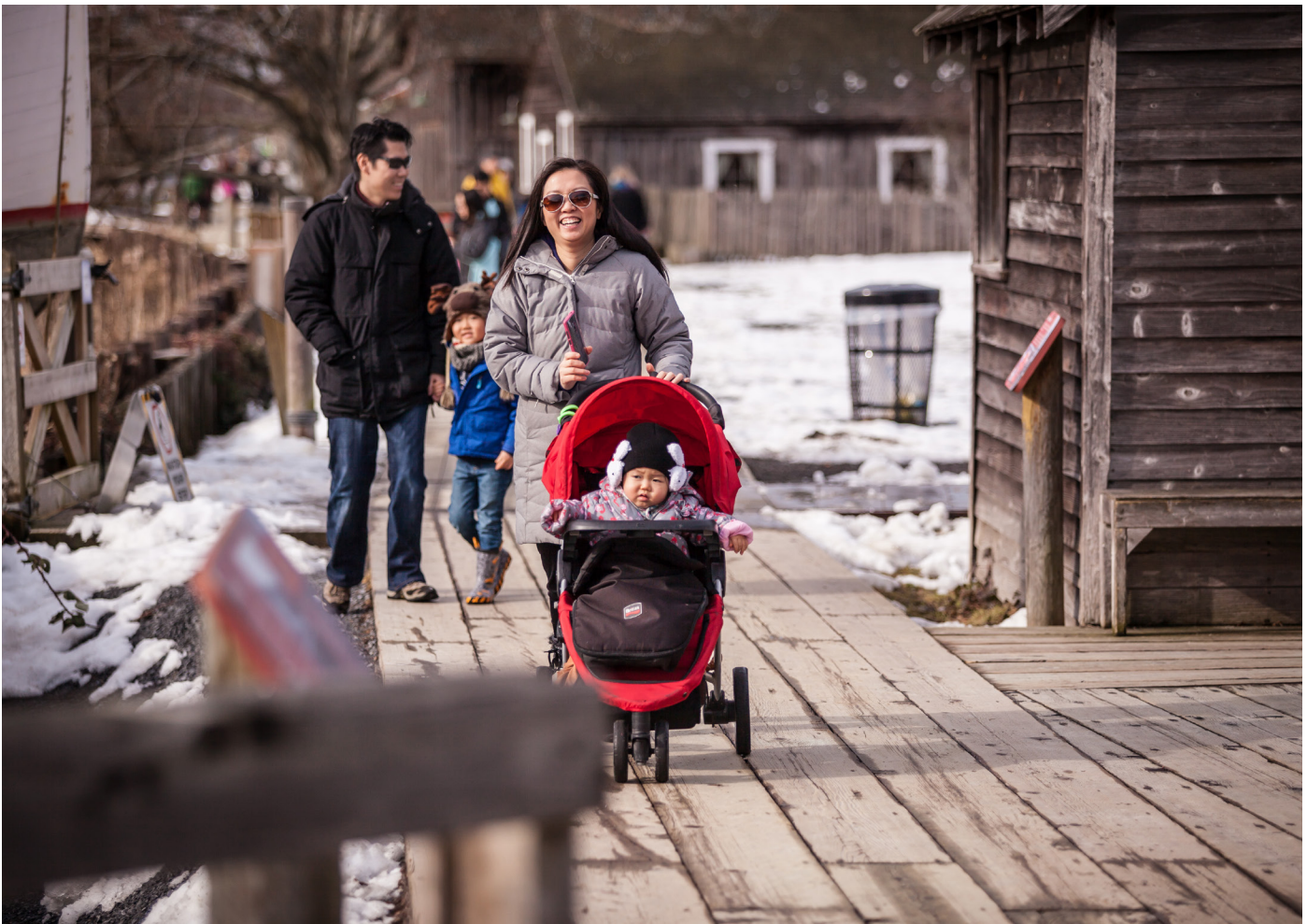
Sitio histórico nacional de los Astilleros Britannia

Richmond sigue atrayendo inmigración de otras partes de Canadá e inmigrantes de muchos otros países. En los últimos años, la mayoría de los nuevos canadienses han llegado de China, Hong Kong, Filipinas e India. La diversidad cultural de la ciudad ha hecho de Richmond un lugar emocionante y vibrante para vivir.