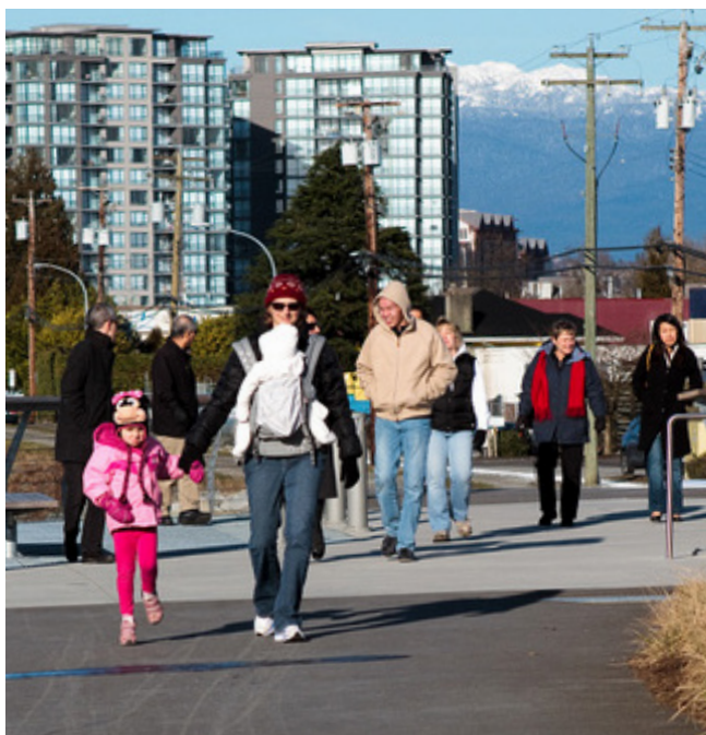
La creciente zona Oval Village de Richmond