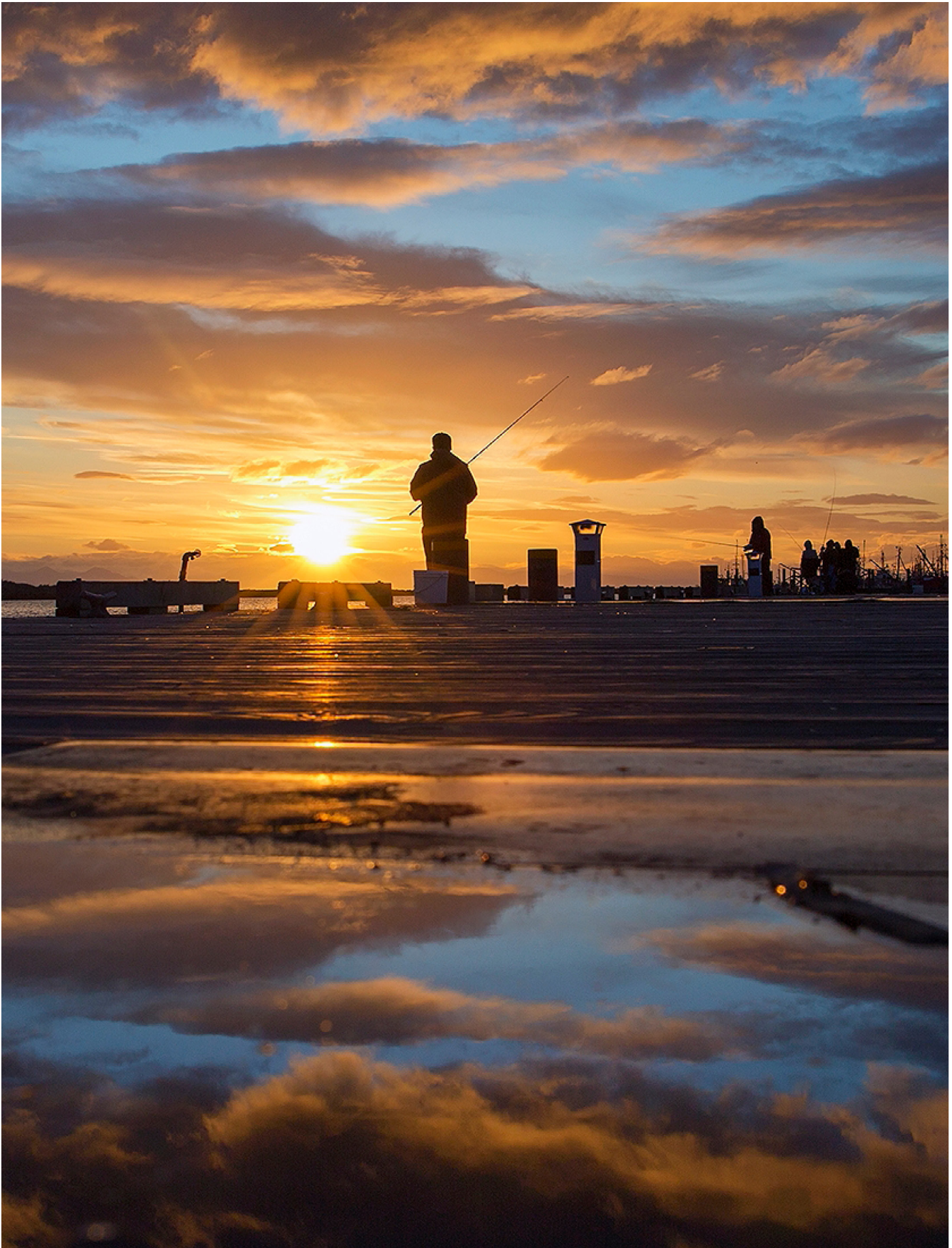
Imperial Landing Moorage / Fishing Float