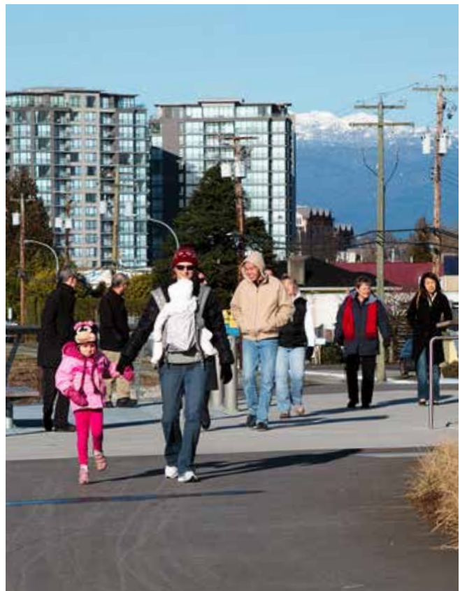
ਰਿਚਮੰਡ ਦਾ ਵਧ ਰਿਹਾ ਓਵਲ ਵਿਲਿਜ਼ ਏਰੀਆ

ਚਾਇਮੋ ਰਿਚਮੰਡ ਰੈਂਟ ਬੈਂਕ (ਸੀ ਆਰ ਆਰ ਬੀ) ਉਨ੍ਹਾਂ ਘੱਟ ਆਮਦਨ ਵਾਲੇ ਵਿਅਕਤੀਆਂ ਅਤੇ ਪਰਿਵਾਰਾਂ ਨੂੰ ਵਾਪਸ ਕਰਨ ਯੋਗ ਫੰਡ ਪੇਸ਼ ਕਰਦਾ ਹੈ ਜਿਨ੍ਹਾਂ ਨੂੰ ਪੈਸਿਆਂ ਦੀ ਟੈਂਪਰੇਰੀ ਘਾਟ ਜਾਂ ਵਿੱਤੀ ਸੰਕਟ ਕਾਰਨ ਡੈਮੇਜ ਡਿਪਾਜ਼ਿਟ ਦੀ ਲੋੜ ਹੈ ਜਾਂ ਕਿਰਾਇਆ ਲੇਟ ਹੋਣ ਕਾਰਨ/ਕਿਰਾਇਆ ਨਾ ਦੇਣ ਕਾਰਨ ਜਾਂ ਜ਼ਰੂਰੀ ਯੂਟਿਲਟੀ ਕੱਟੇ ਜਾਣ ਕਰਕੇ ਘਰੋਂ ਕੱਢੇ ਜਾਣ ਦਾ ਖਤਰਾ ਹੈ। ਪੈਸੇ ਥੋੜ੍ਹੇ ਸਮੇਂ ਲਈ ਵਿਆਜ ਰਹਿਤ ਲੋਨ ਦੇ ਰੂਪ ਵਿਚ ਦਿੱਤੇ ਜਾਂਦੇ ਹਨ। ਜ਼ਿਆਦਾ ਜਾਣਕਾਰੀ ਲਈ: 604-279-7170 ਜਾਂ www.ChimoServices.com/get-help/chimo-richmond-rent-bank