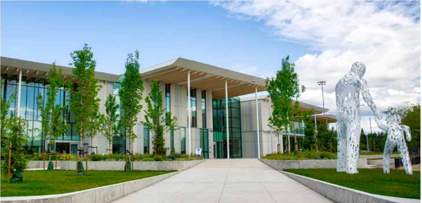
ਮਿਨੋਰੂ ਸੈਂਟਰ ਫਾਰ ਐਕਟਿਵ ਲਿਵਿੰਗ