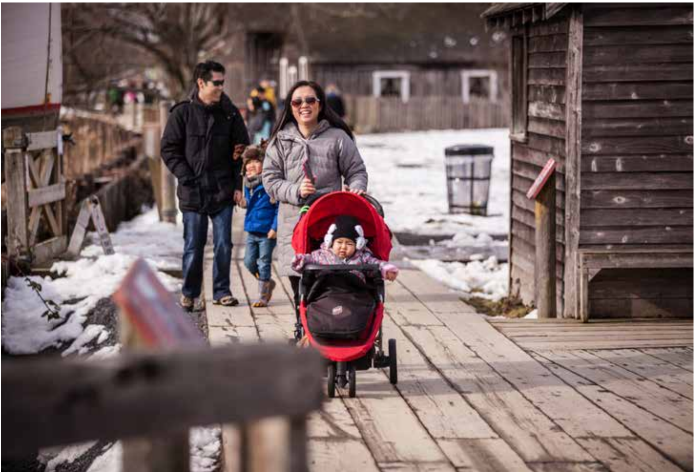
ਬ੍ਰਿਟੇਨੀਆ ਸ਼ਿਪਯਾਰਡਜ਼ ਨੈਸ਼ਨਲ ਇਤਿਹਾਸਕ ਸਥਾਨ

ਰਿਚਮੰਡ ਕੈਨੇਡਾ ਦੇ ਹੋਰ ਹਿੱਸਿਆਂ ਅਤੇ ਬਹੁਤ ਸਾਰੇ ਹੋਰ ਦੇਸ਼ਾਂ ਤੋਂ ਲੋਕਾਂ ਨੂੰ ਖਿੱਚਣਾ ਜਾਰੀ ਰੱਖ ਰਿਹਾ ਹੈ। ਇਨ੍ਹਾਂ ਸਾਲਾਂ ਵਿਚ, ਨਵੇਂ ਕੈਨੇਡੀਅਨਾਂ ਦੀ ਬਹੁਗਿਣਤੀ ਚੀਨ, ਹੋਂਗਕਾਂਗ, ਫਿਲੀਪੀਨ ਅਤੇ ਇੰਡੀਆ ਤੋਂ ਆਈ ਹੈ। ਸ਼ਹਿਰ ਦੀ ਸਭਿਅਚਾਰਕ ਵੰਨ-ਸੁਵੰਨਤਾ ਨੇ ਰਿਚਮੰਡ ਨੂੰ ਰਹਿਣ ਲਈ ਇਕ ਦਿਲਚਸਪ ਅਤੇ ਉਤਸ਼ਾਹ ਭਰਪੂਰ ਥਾਂ ਬਣਾਇਆ ਹੈ।