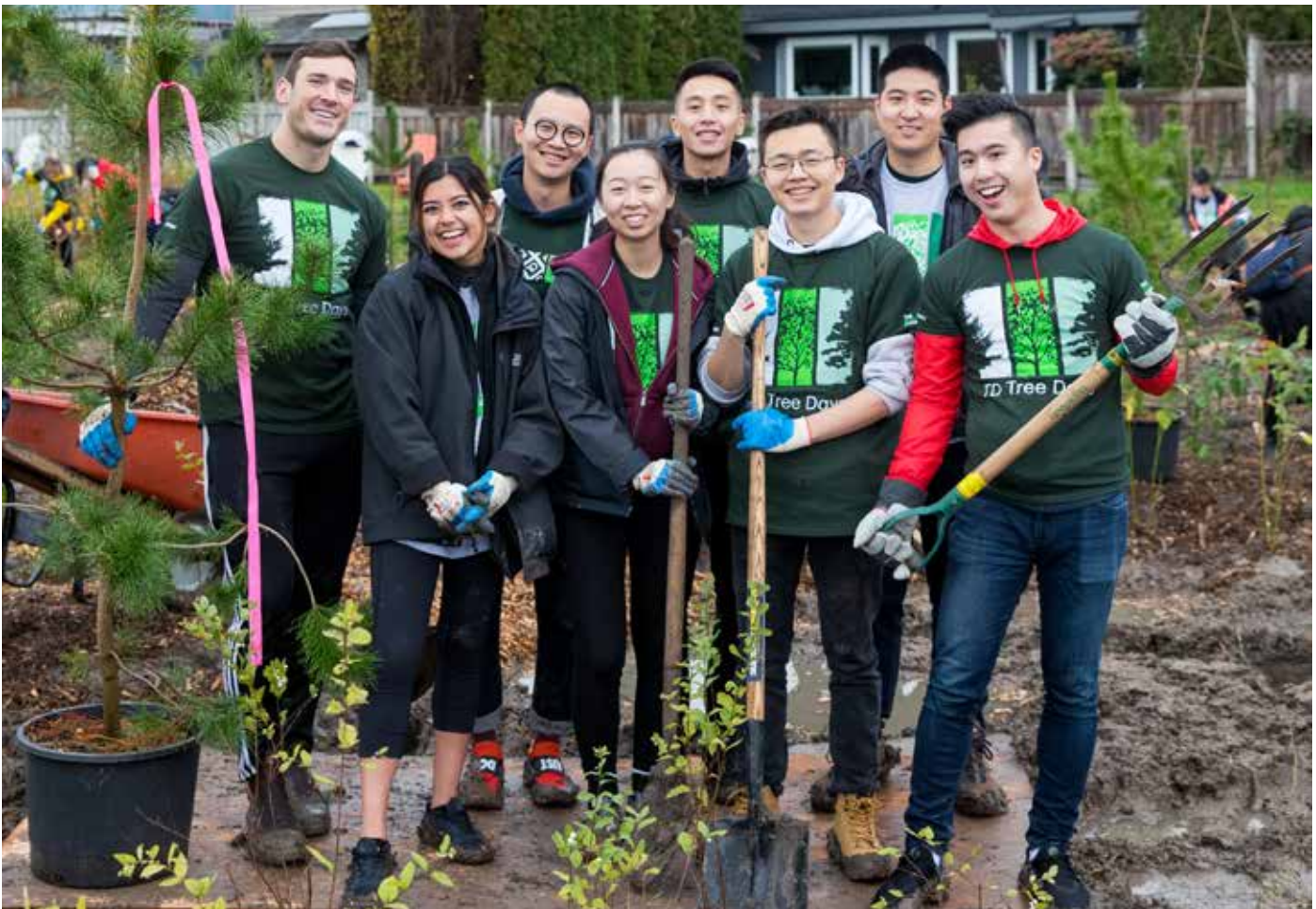
ਟੇਰਾ ਨੋਵਾ ਰੂਰਲ ਪਾਰਕ ਵਿਖੇ ਵਾਲੰਟੀਅਰ ਬਣਨਾ

ਰਿਚਮੰਡ ਚੈਂਬਰ ਔਫ ਕਮਰਸ ਬਿਨਾਂ ਮੁਨਾਫੇ ਤੋਂ ਕੰਮ ਕਰਨ ਵਾਲੀ ਇਕ ਵਿਸ਼ਾਲ ਬਿਜ਼ਨਸ ਮੈਂਬਰਸ਼ਿਪ ਐਸੋਸੀਏਸ਼ਨ ਹੈ ਜਿਹੜੀ ਤਕਰੀਬਨ 1,000 ਮੈਂਬਰ ਬਿਜ਼ਨਸਾਂ ਦੇ ਹਿੱਤਾਂ ਦੀ ਨੁਮਾਇੰਦਗੀ ਕਰਦੀ ਹੈ, ਅਤੇ ਉਨ੍ਹਾਂ ਨੂੰ ਨੈੱਟਵਰਕਿੰਗ ਦੇ ਮੌਕੇ ਪ੍ਰਦਾਨ ਕਰਦੀ ਹੈ। ਬਿਜ਼ਨਸ ਵੱਖ ਵੱਖ ਇੰਡਸਟਰੀਆਂ ਅਤੇ ਕਿੱਤਿਆਂ ਤੋਂ ਹਨ ਅਤੇ ਇਸ ਵਿਚ ਨੈਸ਼ਨਲ ਅਤੇ ਇੰਟਰਨੈਸ਼ਨਲ ਕਾਰਪੋਰੇਸ਼ਨਾਂ, ਦਰਮਿਆਨੇ ਆਕਾਰ ਦੀਆਂ ਫਰਮਾਂ, ਉੱਦਮੀ ਸਟਾਰਟ-ਅੱਪਸ, ਅਤੇ ਛੋਟੀਆਂ ਕੰਪਨੀਆਂ ਸ਼ਾਮਲ ਹਨ। ਜ਼ਿਆਦਾ ਜਾਣਕਾਰੀ ਲਈ: www.RichmondChamber.ca