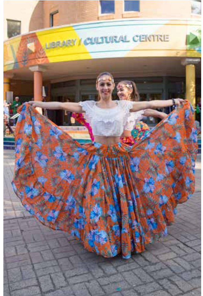
ਰਿਚਮੰਡ ਦੇ ਕਲਚਰ ਡੇਅਜ਼

ਰਿਚਮੰਡ ਵੱਖ ਵੱਖ ਸਭਿਆਚਾਰਾਂ, ਬੋਲੀਆਂ, ਰਵਾਇਤਾਂ ਅਤੇ ਦਸਤੂਰਾਂ ਦਾ ਘਰ ਹੈ। ਸਮੇਂ ਨਾਲ, ਵੱਖ ਵੱਖ ਗਰੁੱਪਾਂ ਨੇ ਆਪਣੀਆਂ ਸਭਿਆਚਾਰਕ ਐਸੋਸੀਏਸ਼ਨਾਂ ਅਤੇ ਭਾਈਚਾਰੇ ਤਿਆਰ ਕਰ ਲਏ ਹਨ। ਨਵੇਂ ਆਉਣ ਵਾਲੇ ਨਵੇਂ ਦੋਸਤਾਂ ਨੂੰ ਮਿਲਣ ਅਤੇ ਇੱਥੇ ਰਿਚਮੰਡ ਵਿਚ ਜ਼ਿੰਦਗੀ ਦੀ ਤਬਦੀਲੀ ਵਿਚ ਮਦਦ ਲਈ ਇਨ੍ਹਾਂ ਗਰੁੱਪਾਂ ਨਾਲ ਜੁੜਨਾ ਚਾਹ ਸਕਦੇ ਹਨ। ਐਥਨਿਕ ਸੰਸਥਾਵਾਂ ਦੀ ਲਿਸਟ ਲਈ: www.richmond.ca/discover/com-resources/organizations/arts.htm#EthnicGroups .