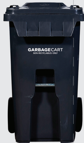
大桶 單戶住宅標準容量 240公升 深 27.5 x 寬 24.5 x 高 43 吋