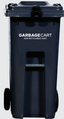
中桶 城市屋標準容量 120公升 深 21.5 x 寬 19 x 高 37.5 吋