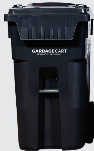
特大桶 360公升 深 34.5 x 寬 25 x 高 44.5 吋

住戶可以更換不同容量的垃圾桶；而行人道旁垃圾收集費，則按所更換的垃圾桶容量而調整。更換垃圾桶，每次收費$25。