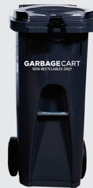
小桶* 80 公升 深 20 x 寬 16 x 高 34.5 吋 * 另有特小桶(46.5 公升)供住戶選用，其收費與小桶一樣。

有關不同容量垃圾桶及相對行人道旁垃圾收集費的詳情，請瀏覽： www.richmond.ca/garbage 。 安排更換垃圾桶，請致電環保計劃署：604-276-4010 或電郵： garbageandrecycling@richmond.ca 。